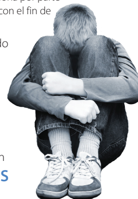
Robers et al. (2013)